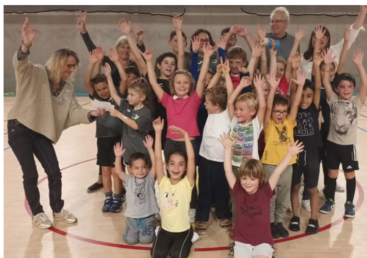
Equipe Baby 2022