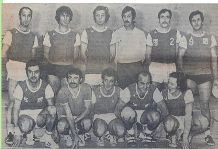
Equipe Loisir 1978

Il convient de souligner que la compétition fait partie intégrante des valeurs du HandBall. Même si une approche purement « Loisir » est tout à fait envisageable, nos jeunes ne pourront réellement évoluer et s'investir dans ce sport que par l'approche « Equipe » qui se réalise pleinement à l'occasion des tournois.