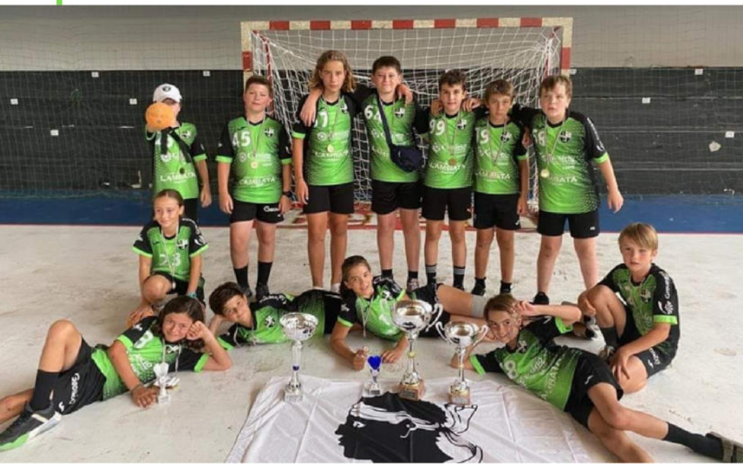
Equipe des U13/U15 ramenant des coupes gagnées lors d'un tournoi en Sardaigne. Juin 2022